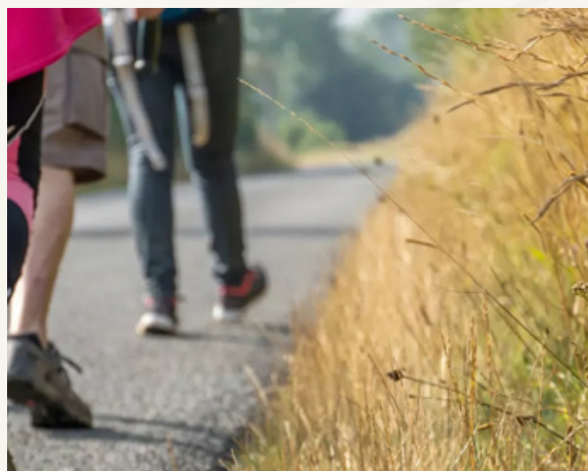
➔ Parcours de 10 km – Boucle des Marais

TÉLÉCHARGEZ VOS ITINÉRAIRES : Disponibles aux formats PDF et GPX https://fnau45.aud-stomer.fr/fr/visiter