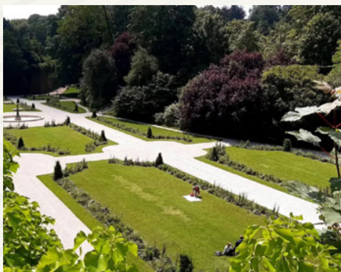
➔ Parcours de 5 km – Boucle patrimoniale

Pour un réveil sportif en toute sécurité, prévoyez votre lampe frontale et votre collation.